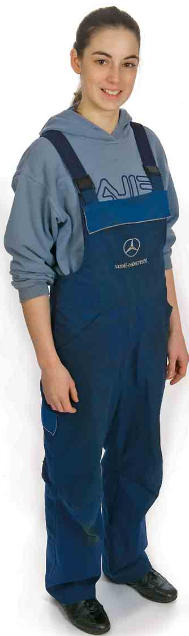
Avant: Une tenue pour l'atelier, qui ne convient plus aux nouvelles fonctions de notre modèle.